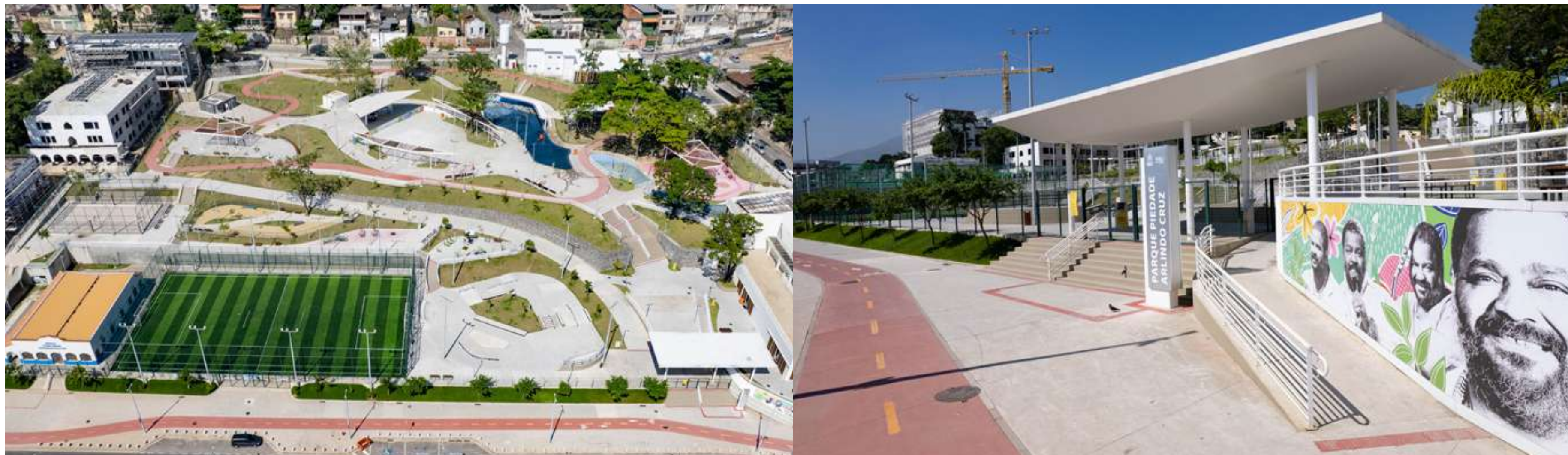
PARQUE ARLINDO CRUZ