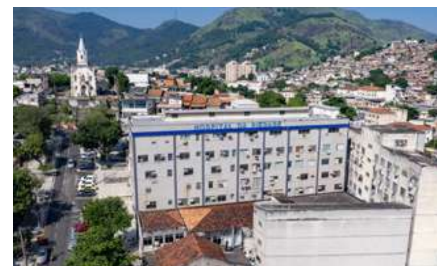
HOSPITAL MUNICIPAL DE PIEDADE