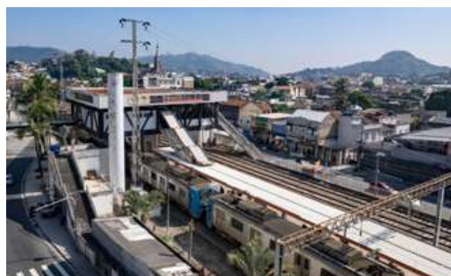
ESTAÇÃO DE TREM PIEDADE